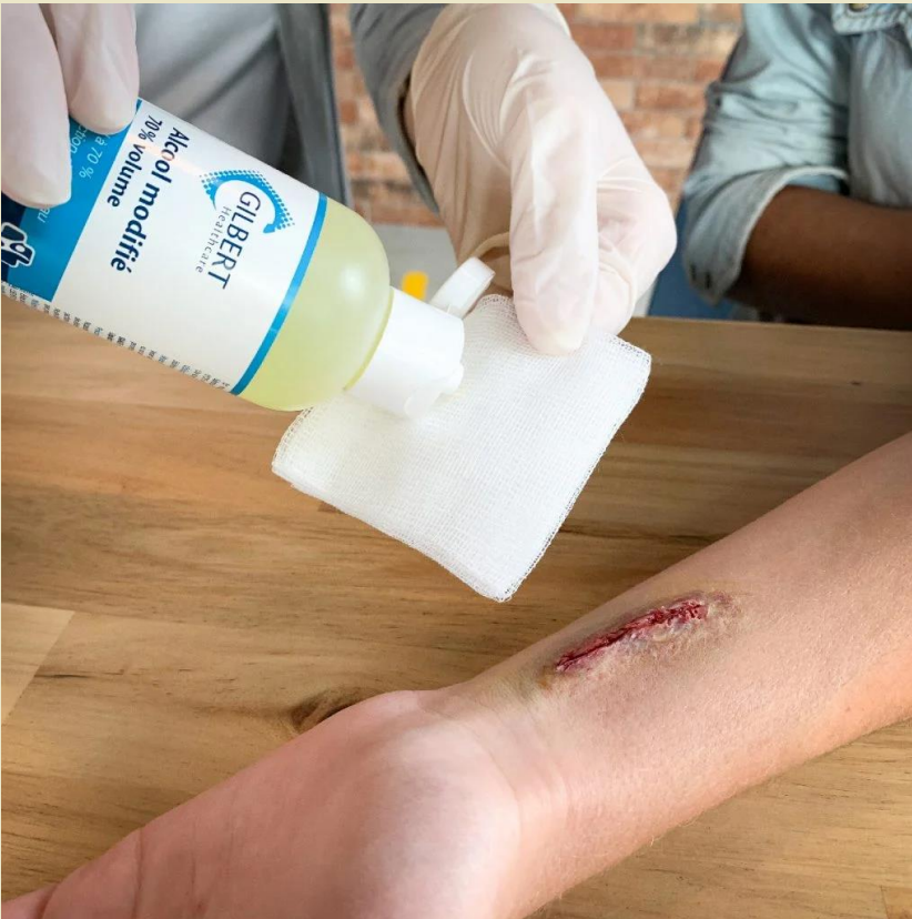
Désinfecter et sécher la plaie