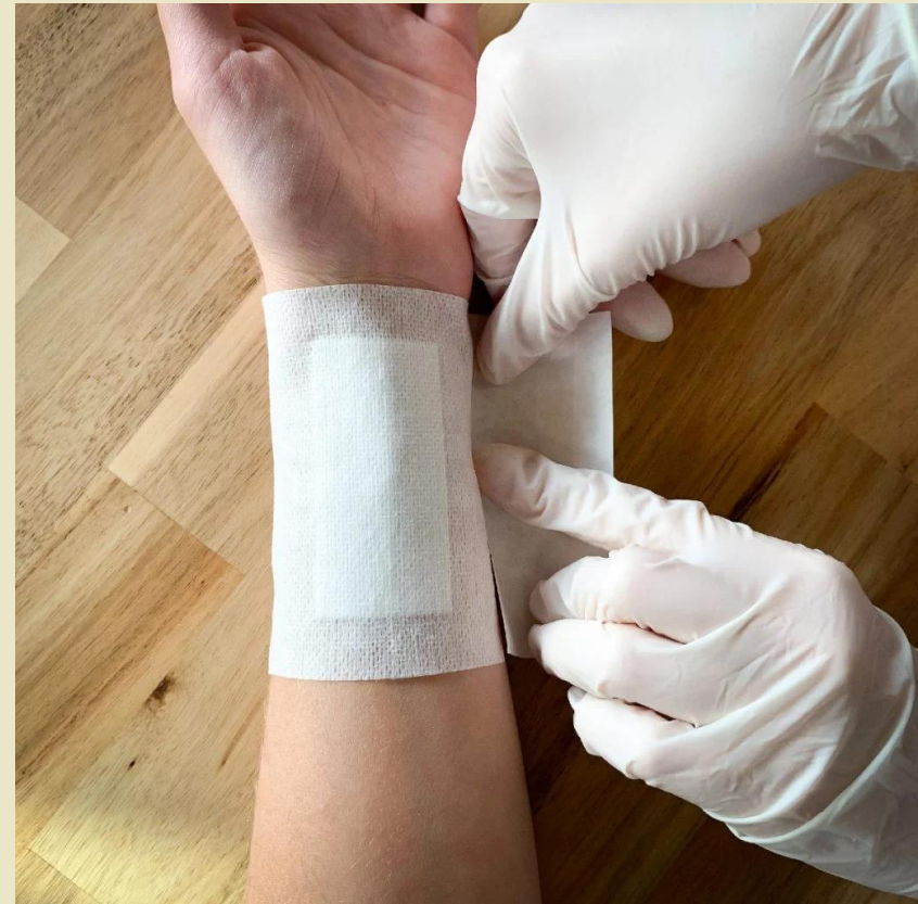
Recouvrir l'ensemble d'un pansement