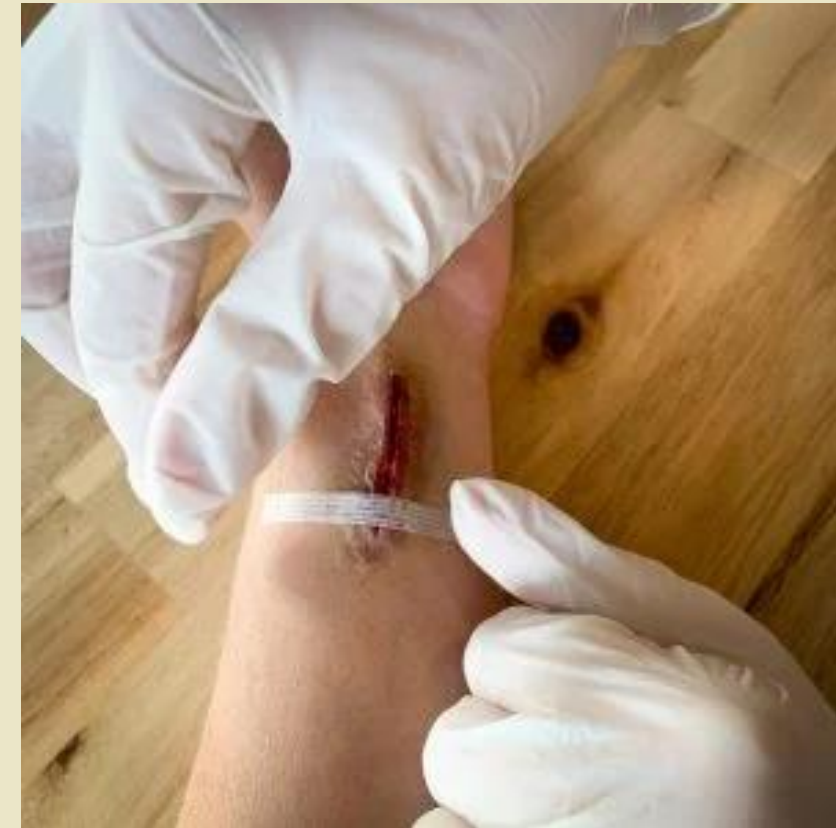
Disposer la suture adhésive à la perpendiculaire de la plaie