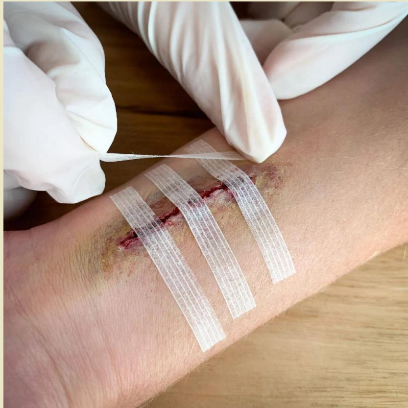
Poser 2 ou plus de sutures adhésives perpendiculaires aux premières