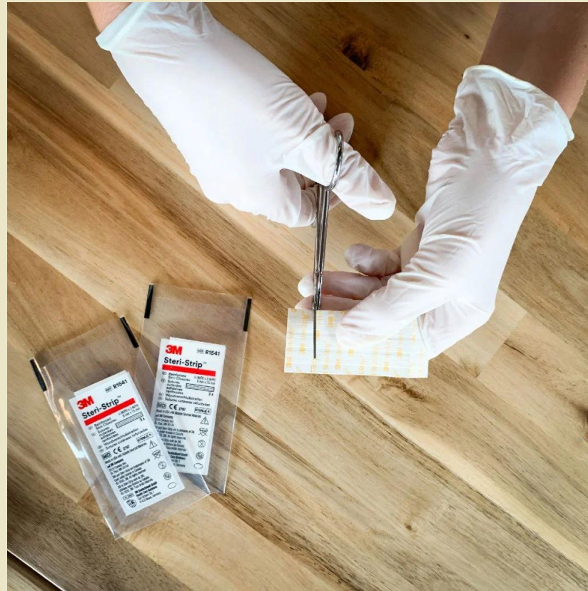
Découper la suture adhésive