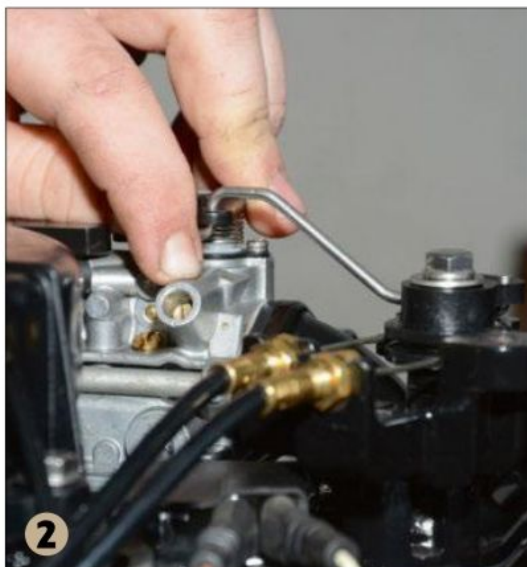
2 ▲ On règle ensuite la vis de richesse (en laiton, située sur le carburateur), en tournant de quart en quart. Le but est de trouver le régime le plus haut possible en réglant uniquement cette vis-là.