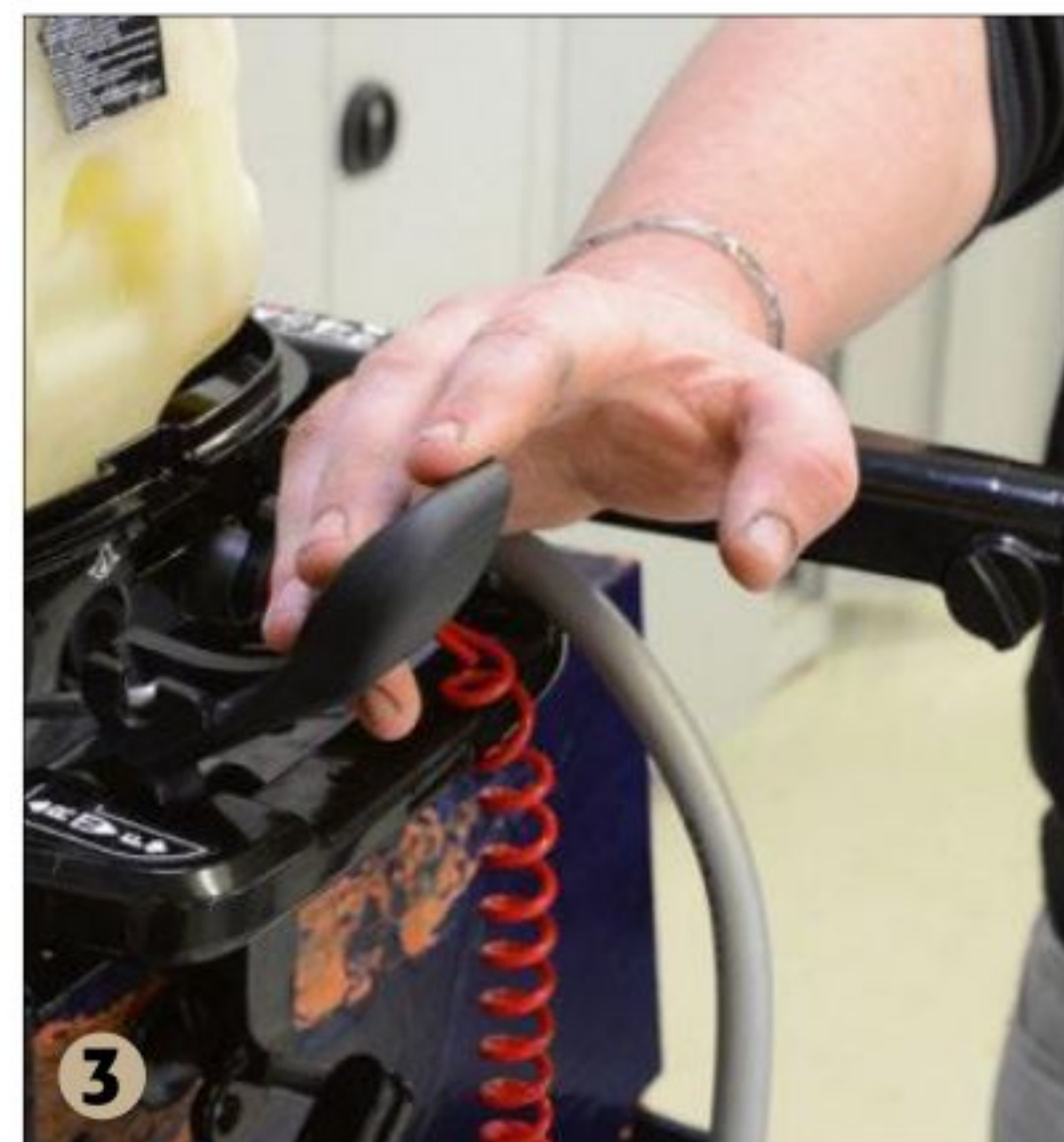
3 ▲ Quand le réglage de la vis de richesse est convenable, n'y touchez plus et peaufinez le réglage du ralenti (vis avec le ressort), moteur embrayé, afin qu'il ne cale pas.